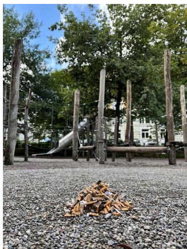
Immagine 2: In un solo parco giochi sono stati raccattati ben 686 mozziconi.