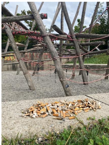
Immagine 3: Nei parchi giochi ispezionati dalla community di stop2drop sono stati raccattati 15'479 mozziconi.