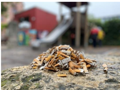
Immagine 1: In un parco giochi su quattro sono stati raccattati oltre 100 mozziconi.